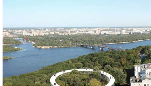
pie de imagen: TALLER 301/ Administración de la Ciudad-Estado de Kiev, Ucrania. Vistas de los Prototipos de los "anillos-nodos". Ilustración: TALLER 301