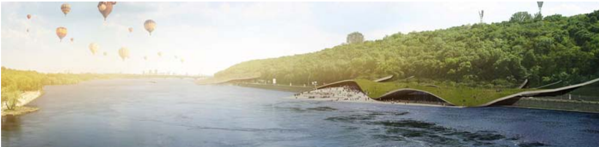
pié de imagen: TALLER 301/ Administración de la Ciudad-Estado Kiev, Ucrania. Vista del puente terrestre conectando la ciudad con el agua. Ilustración: TALLER 301

Abril 30/2011 - Después de presentar el proyecto frente a los miembros del jurado en Kiev/Ucrania, TALLER 301 recibió el Primer Premio para el Concurso Internacional de Arquitectura PAISAJISMO URBANO EN KYIV PARA LA EURO-2012. El proyecto titulado Reclaiming the Shore consta de 413 hectáreas entre el Río Dniéper y el Centro Histórico, y prevé una serie de intervenciones que tendrán que ser desarrolladas para la Euro-copa de Fútbol UEFA 2012 organizada en Kiev, al igual que una visión a largo plazo para la ciudad.