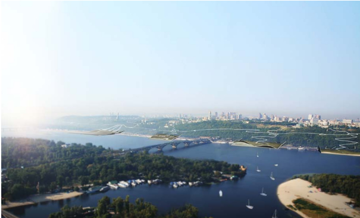
pié de imagen: TALLER 301/ Administración de la Ciudad-Estado de Kiev, Ucrania. Vista aérea de los puentes terrestres.